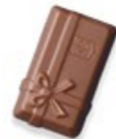
BALLOTIN Praliné et éclats d'amandes caramélisées et salées