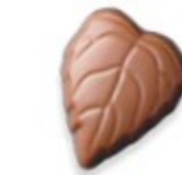
FEUILLE Praliné tendre aux noisettes