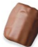
FEILLANTINE Praliné gianduja et émietté de crêpe dentelle