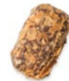
DENTELLE Praliné onctueux aux noisettes enveloppé d'éclats de crêpe dentelle