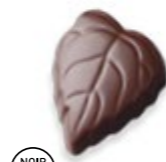
NOIR 70° FEUILLE Praliné intense aux noisettes