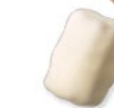
BISCUITINE Praliné gianduja et riz soufflé