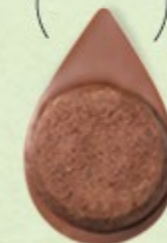
BISCUIT BROWNIE Chocolat au lait 35% de cacao