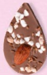
LE SONGE DE JULIETTE Chocolat au lait 35% de cacao, amande, éclats de nougat, brins d'anis