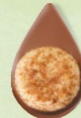
BISCUIT NOISETTES Chocolat au lait 35% de cacao