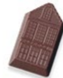
NOIR 70° MAISON DE JEFF Praliné aux éclats d'amandes, épice de cannelle et de coriandre