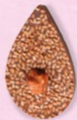
GRAINE DE JULIETTE Chocolat au lait 35% de cacao, sésame, noisette caramélisée