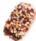
MUESLI Praliné gourmand, éclats de biscuits et de framboise, billes de chocolat noir