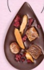
JULIETTE & TOM Chocolat noir 60% de cacao, dés d'abricots secs, amandes caramélisées et morceaux de cerise