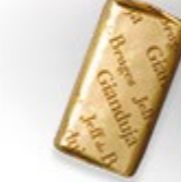
BLOC GIANDUJA Gianduja, la recette originale