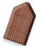
MAISON DE JEFF Praliné aux éclats de nougat