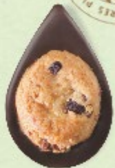
BISCUIT CRANBERRIES Chocolat noir 60% de cacao