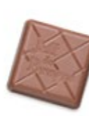
CAFETERO Tendre praliné aux noisettes et aux éclats de café force « ristretto »