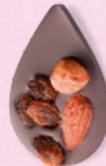
JULIETTE IN THE CITY Chocolat noir 70% de cacao, amande, noisette, raisins secs