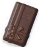
BALLOTIN Praliné et éclats de noisettes caramélisées