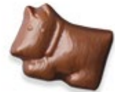
WARREN Praliné et graines de sésame torréfiées et caramélisées