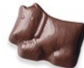
HARVEY Praliné onctueux et éclats de crumble