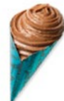
CORNET BLEU Gianduja croustillant et éclats de crêpe dentelle