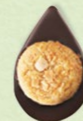
BISCUIT AMANDES Chocolat noir 60% de cacao